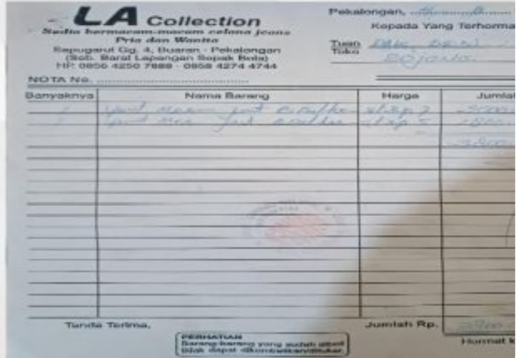
Foto : Seorang Pria Berinisial S (35) Warga Kelurahan Banyuurip, Kecamatan Pekalongan Selatan, Kota Pekalongan, Jawa Tengah Dilaporkan ke Pihak Kepolisian Polres Pekalongan_ Polda Jateng.

PEKALONGAN- Seorang pria berinisial S (35) warga Kelurahan Banyuurip, Kecamatan Pekalongan Selatan, Kota Pekalongan , Jawa Tengah dilaporkan ke